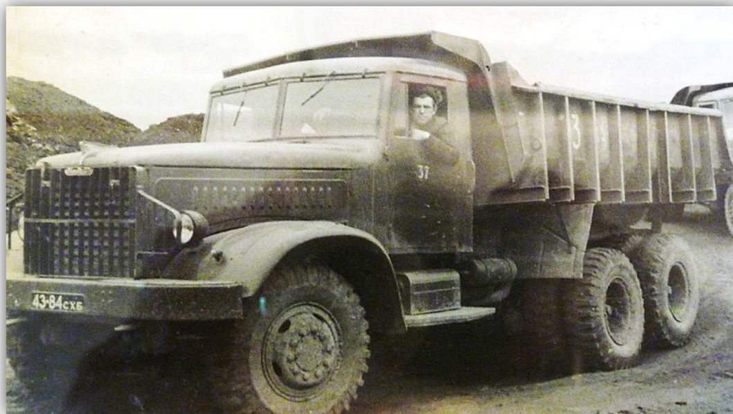
Вахрушевская автобаза. Автомобиль КраЗ

О результатах перевода на ежесуточный учет себестоимости Тихменевской шахты 10-13.