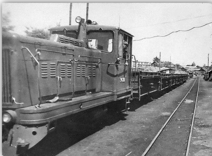
Тепловоз узкоколейный (ТУ4)